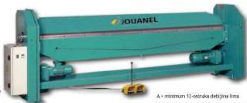
A = minimum 12-struka debljina lima

Prese za savijanje PTL su namenjene za limarske radove pri pokrivanju krovova , izradu opšivki , sistema ventilacije i elemenata od aluminijumskog lima . Sistem rada mašine je u potpunosti električan, samim tim obezbeđuju veliku produktivnost , a istovremeno su univerzalne i proste u eksploataciji.